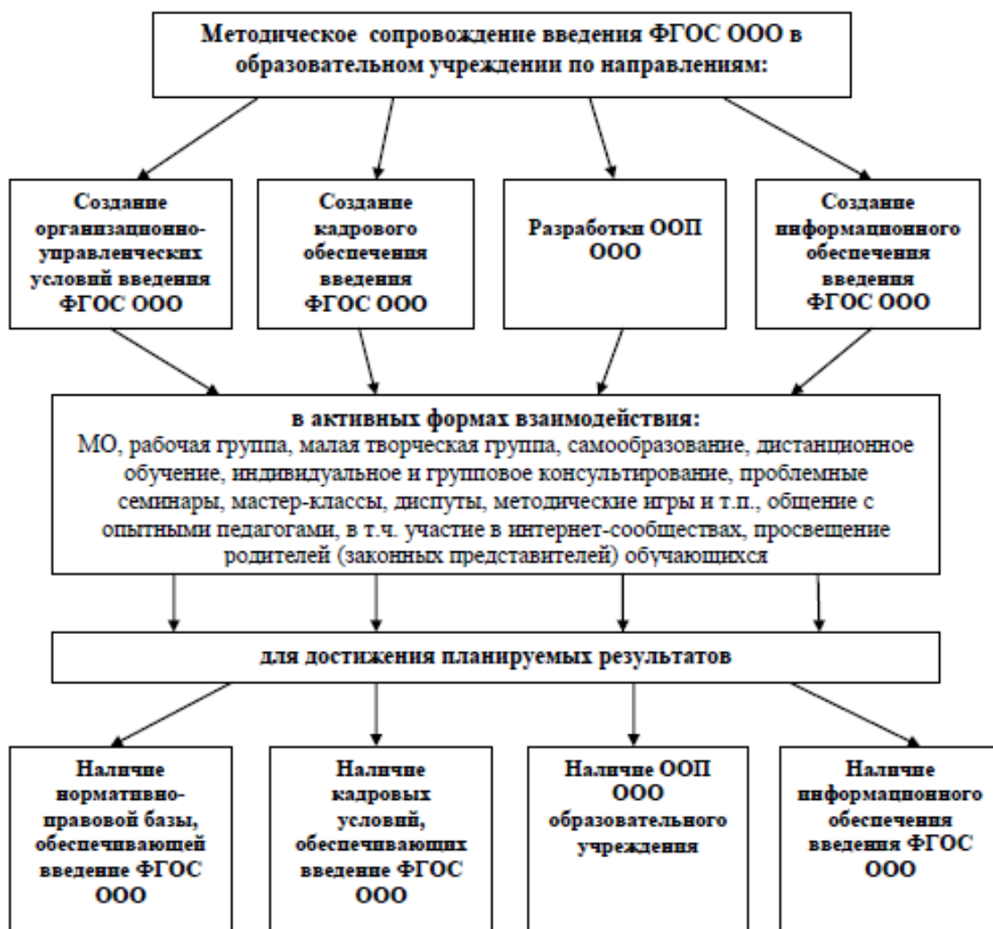
Схема методического сопровождения введения ФГОС ООО

В основе модели методического сопровождения введения ФГОС ООО лежат следующие принципы :